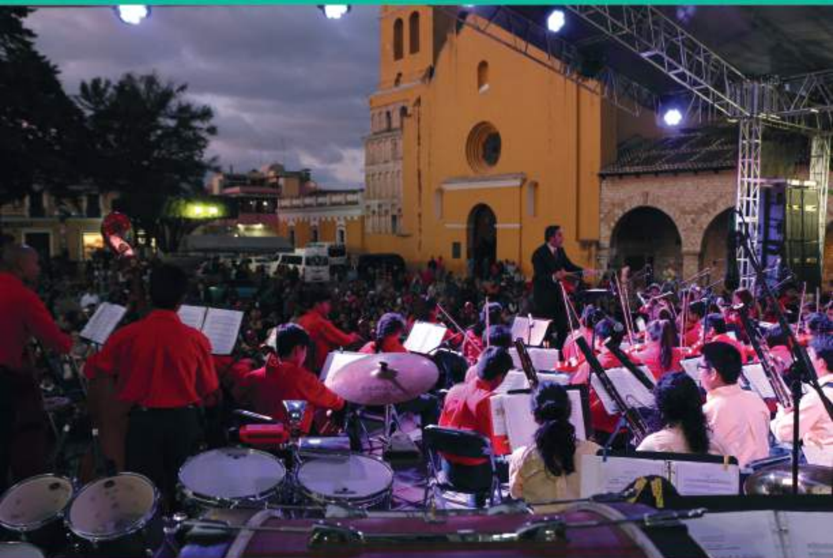
Fotografía: Cierre del Tercer Encuentro del Seminario Permanente de Inclusión y Familia del CRESUR, Comitán de Domínguez, Chiapas, Noviembre 2016.